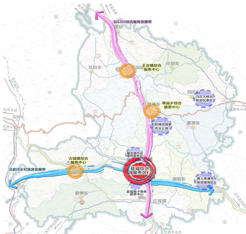
图 4-1 彭阳服务业总体空间布局

“五基地”：黄土塬瀑布旅游度假区、彭阳梯田国家农业公园、冯庄大峡谷旅游风景区、县城电子商务服务中心、醒龙塘休闲康体服务区。